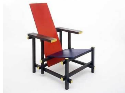
(Collectie Centraal Museum)

5 Welke andere beroemde Nederlandse kunstenaar hoort bij dezelfde groep kunstenaars als Mondriaan en werd beroemd om deze stoel?