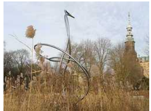
Dit staat in het Oosterpark in Amsterdam

In de negentiende eeuw was dichtkunst, of poëzie, een zelfstandige kunstvorm geworden. 19 Eeuwse poëzie had een sterk moraliserend en opvoedend karakter. Vaak had een gedicht een religieuze grondslag: in gedichten werden mensen opgeroepen zich te houden aan de wetten van de bijbel.