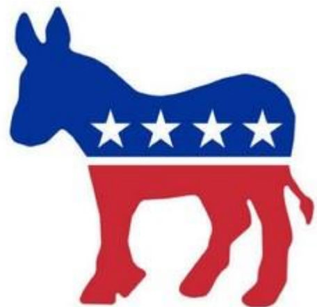
Het logo van de Democratische Partij

De Democraten zijn progressiever en hervormingsgezind, zij richten zich meer op 'de gewone man'. Daarom willen zij een sterke regering en president. De Democraten hebben daarom veel aanhang in de grote steden.