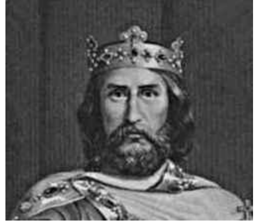
We denken dat Karel de Grote er zo uitzag

Het is niet duidelijk wanneer Karel de Grote werd geboren. Wetenschappers denken 2 april 742. Zesentwintig jaar later, in 768, overleed zijn vader Pepijn III. Vanaf dat moment was Karel de koning.