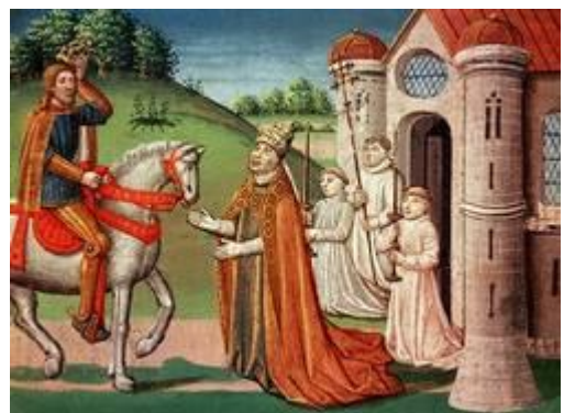
Karel de Grote en de paus

Karel de Grote was een erg gelovig man. Toen hij hoorde dat in 773 de Italiaanse Langobarden Rome, het land van paus Stefanus, in wilden nemen, kwam hij dan ook meteen in actie. Hij trok met zijn leger naar Italië en versloeg de Langobarden. De paus was Karel erg dankbaar voor zijn hulp; Karel mocht zich vanaf toen 'koning der Franken en Langobarden' noemen.