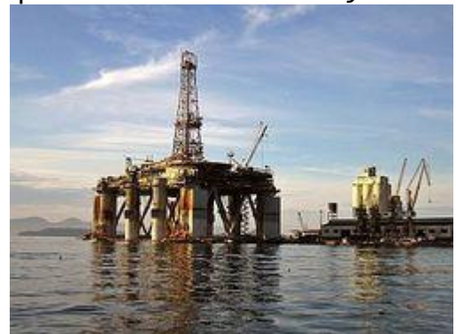
Op zee halen booreilanden olie uit de bodem

Ook aardolie is een fossiele brandstof. Aardolie ontstond op ongeveer dezelfde manier als steenkool. Alleen werden er geen planten samengedrukt, maar 'plankton'. Dat zijn kleine diertjes in de zee. Waar nu aardolie in de grond zit, was vroeger dus zee.