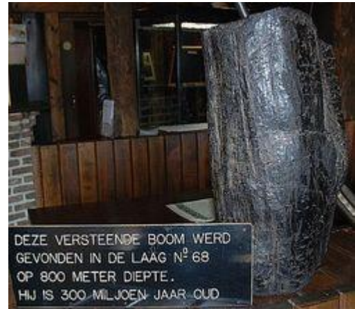
Deze versteende boom werd in een steenkoolmijn gevonden