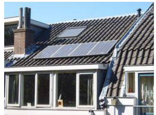
Zonnecollectoren op een huis