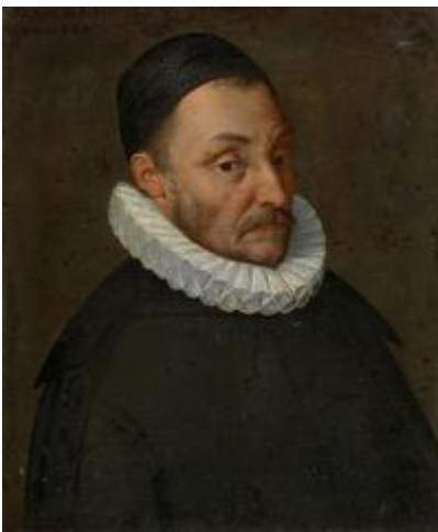
Willem van Oranje

Vanuit de Dillenburg gaf Willem van Oranje leiding aan de opstand in de Nederlanden tegen koning Filips II en zijn landvoogd Alva. Hij stelde aanvals- plannen op en zorgde voor geld voor de legers.