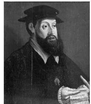
Karel V AHM

Willem moest zich voorbereiden op een belangrijke positie in de Nederlanden.