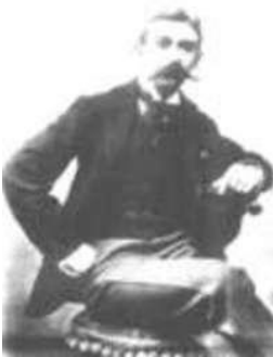
Pierre de Coubertin

Zo'n 1600 honderd jaar geleden hebben de Oude Grieken de Olympische Spelen opgeheven. Honderden jaren zijn er geen Olympische Spelen meer gehouden.